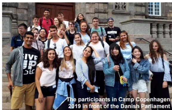
The participants in Camp Copenhagen 2019 in front of the Danish Parliament

Short Terms Exchange program (sommerleire/camps ) er en del av Rotarys