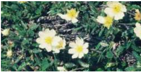
Fylkesblomst Sør-Trøndelag REINROSE Dryas octopetala Fam. Rosaceae, rosefamilien.