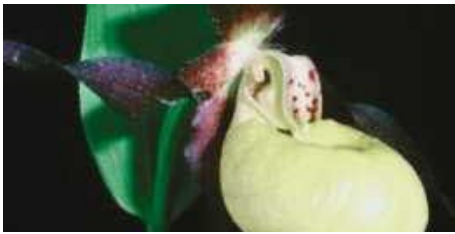
Fylkesblomst Nord-Trøndelag MARISKO Cypripedium calceolus Fam. Orchidaceae, orkidéfamilien eller marihåndfamilie