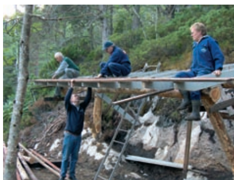
Bygging av gapahuk i skogen ved Skarsveien juni 06.

Intervju med Midsund Rotary Klubb. En av de minste klubbene i distriktet, 16 medlemmer, og en av de med høyest oppmøte i 2005/2006, dette er imponerende.