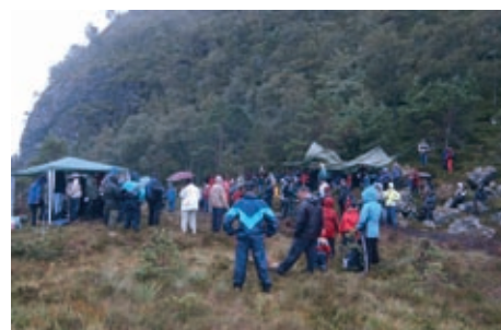
4 bilder fra åpningen av Gapahuken i grisver.

Intervju med Midsund Rotary Klubb. En av de minste klubbene i distriktet, 16 medlemmer, og en av de med høyest oppmøte i 2005/2006, dette er imponerende.