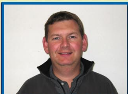
REDAKTØREN HAR ORDET