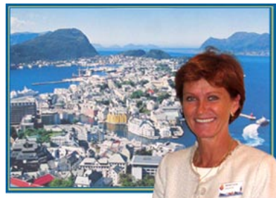
Mer på side 3