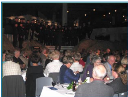
Varde mannskor underholdt med shanties